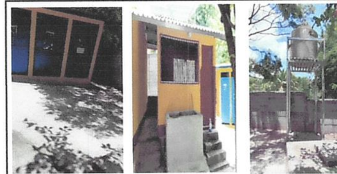
Foto 6: Instalación de estructura metalica y deposito de agua, torta de cemento rustico y construcción de pila de dos lavaderos.

Observación: Si es necesario se pueden agregar hojas adicionales y actualizar el número de hojas.