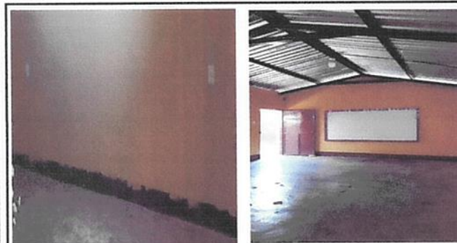
Foto 5: Instalación de toma corrientes, plafoneras y bombillas ahorradoras.