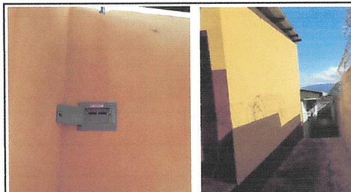
Foto 4: reparación de cableado electrico y sustitución de conductos, cambio de caja para flipones para la cometida electrica.