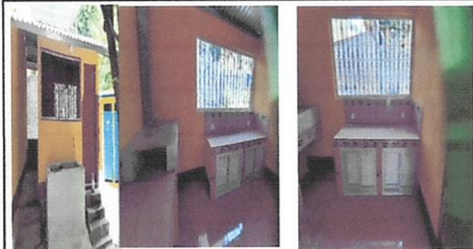
Foto 2: Instalación de estufa rural con su respectivo azulejo en el poyeton así mismo alargado del cemento de la estructura de la estufa, construcción de mueble de cocina con sus respectivas puertas de PVC y