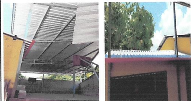
Foto 1 : Instalación de galera con su estructura metalica y lámina troquelada, instalación de en cocina con su estructura metalica y lámina troquelada