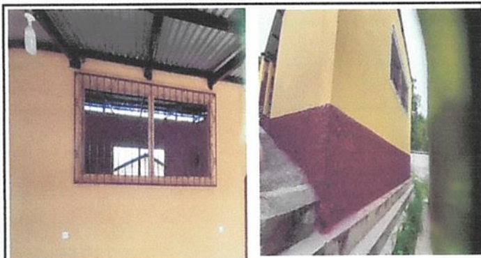
Foto 3: Mantenimiento a balcones (lijado, Pintado e instalación de su respectivo mosquitero de plastico) y pintura general en los muros interiores y exteriores de la escuela